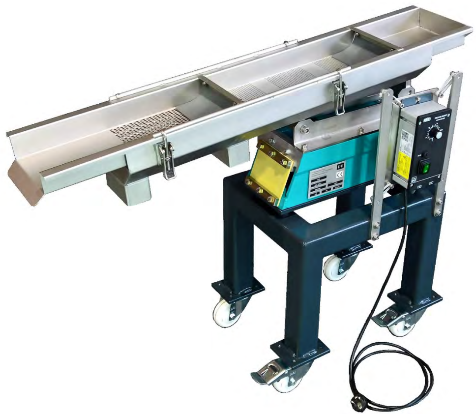
Siebmaschine PT-S150 PT-S300